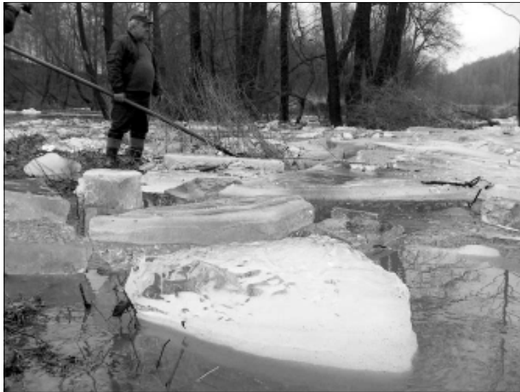
W Rudzie trzeba było rąbać lód, który utworzył zatory na rzece