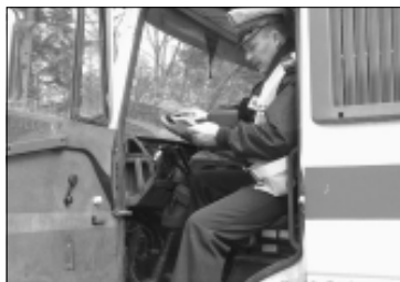
Policjanci już sprawdzają czas pracy kierowców

- Teraz musimy wysłać dwóch kierowców, więc automatycznie zmniejszą się wynagrodzenia dla pracowników - usłyszeliśmy w firmie Ecurex w Kielcach. - Pojawiają się też problemy z dotrzymaniem terminowości zamówień