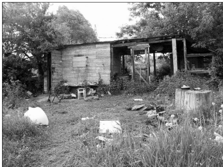
Jedno z „mieszkań” kieleckich bezdomnych

Są też przypadki szczególne. Niespełna dwudziestoletni uczeń jednej z kieleckich szkół otrzymał w spadku po zmarłej babci mieszkanie. Najbliższy jego przyjaciel namówił go, by sprzedał je, za uzyskane pieniądze kupił tańsze w Ostrowcu Św. i spróbował rozkręcić mały biznes. Chłopak tak też uczynił, a pieniądze wpłacił na konto przyjaciela, gdyż ten obiecał mu pomoc w załatwieniu wszelkich formalności. Ale przyjaciel ulotnił się i ślad po nim zaginął.